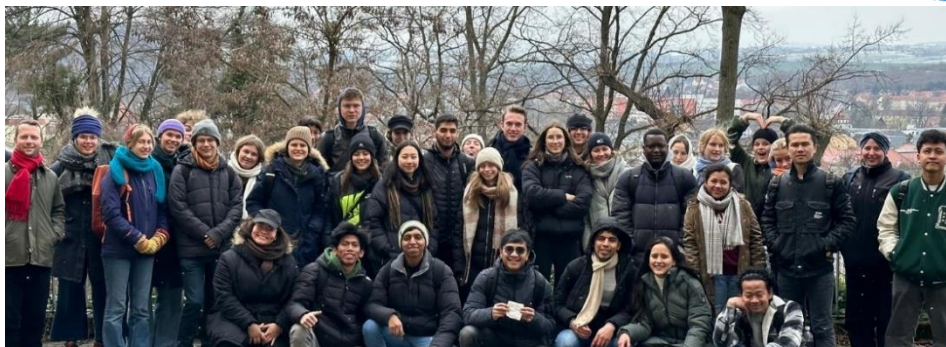
Besuch der Euthanasie-Gedenkstätte Pirna-Sonnenstein während der Zwischenreflexion

Im Januar bzw. März 2023 trafen sich insgesamt ca. 100 Freiwillige des September-Jahrgangs 2023/24 aus Deutschland und aus aller Welt zu ihrer Zwischenreflexion in Dresden.