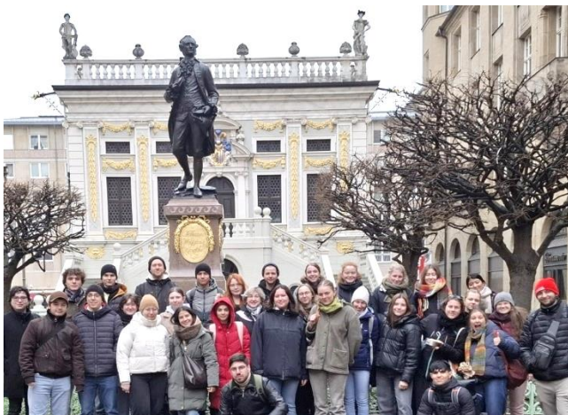
Foto: Gruppenbild mit Goethe – beim Besuch des Zeitgeschichtlichen Forums in Leipzig im Rahmen der Zwischenreflexion erkunden Freiwillige aus Deutschland zusammen mit internationalen Freiwilligen Spuren der Geschichte und tauschen sich über ihre Bedeutung für heute aus.

Mit mehr als 70 Freiwilligen wird der kommende Entsendejahrgang wieder ein starker Jahrgang! Wir freuen uns auch, dass wir unser Stellen- und Partnernetzwerk erweitern konnten: neu sind Einsatzstellen in Brasilien (Straßenfußballprojekt), Bosnien-Herzegowina (Caritas Sarajevo), Kolumbien (Schulpartnerschaft des hessischen Vereins Aguablanca e.V.), Kosovo (Concordia Sozialprojekte und Jugendzentrum Ardhmëria-Klinë) sowie Rumänien (integratives Schulprojekt des ICE-Mitglieds Copiii Europei).