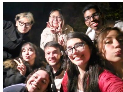
Foto: Abendliche Lagerfeuerstimmung beim Incoming-Einführungsseminar

Auch bei den Einsatzstellen im Bereich Aufnahme wächst die ICE-Familie weiter: Die Vinzenz von Paul gGmbH soziale Dienste und Einrichtungen in Schwäbisch Gmünd ist neuer Partner für die Aufnahme internationaler Freiwilliger.