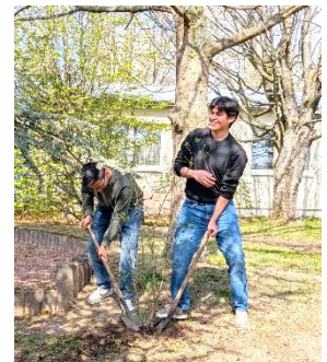
Foto: Pack-an-Aktion im Frühling, Hans-und-Sophie-Scholl-Haus

E-Mail: info@freiwilligendienst.de www.freiwilligendienst.de