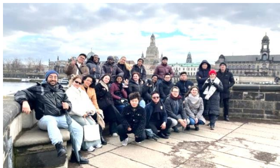
Foto: Incoming-Freiwillige des März-Jahrganges 2026 bei ihrer ersten Exkursion nach Dresden.

Insgesamt setzen sich derzeit 83 Freiwillige aus aller Welt in Wohngruppen für Menschen mit Behinderungen und in anderen sozialen Einrichtungen in Deutschland ein. Darunter sind 18 Freiwillige, die ihren Dienst verlängern, 18 weitere werden ihren Dienst ab September verlängern. Das freut uns sehr!!