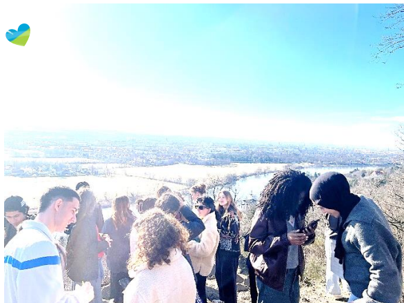
Foto: Gemeinsame Zwischenreflexion – Die Incoming- und Outgoing-Freiwilligen konnten beim Erfahrungsaustausch die Frühlingssonne und den Blick über die Elbe und Dresden genießen. Sie erzählten einander von Höhepunkten und Herausforderungen der vergangenen Monate und suchten dabei gemeinsam nach Lösungen.

Die Freiwilligen des Jahrgangs 2025-26 befinden sich auf der Zielgeraden ihres Freiwilligendienstes. In den letzten Monaten waren die knapp 70 Freiwilligen in ganz unterschiedlichen Bereichen aktiv, konnten Erfahrungen sammeln und wertvolle Unterstützung leisten. Auf den Zwischenreflexionen beim ICE haben sie sich mit den Incoming-Freiwilligen über ihre bisherigen Erfahrungen ausgetauscht und sich in unterschiedlichen Bereichen weitergebildet. Besonders bereichernd empfanden sie den interkulturellen Austausch während der Seminare: „Ein Raum, der Freiwillige aus der ganzen Welt zusammenbringt – man kann nur sagen, das ist toll“. So wurde das Hans-und-Sophie-Scholl-Haus wieder zu einem „besonderen Ort, der Halt, Hoffnung und Heimat gibt“ (Freiwilligen-Zitat).