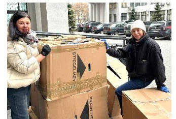
Foto rechts: Dringend benötigte Hilfsgüter sind bei unserem ICE-Mitglied 3D-Perpekiva in Charkiw (Ukraine) gut angekommen – Herzlichen Dank den Spendern!

Alumni: Mach mit! 😊 Schulpräsentationen, Messen, Seminarassistent, ÖA...? (entsendung@freiwilligendienst.de)