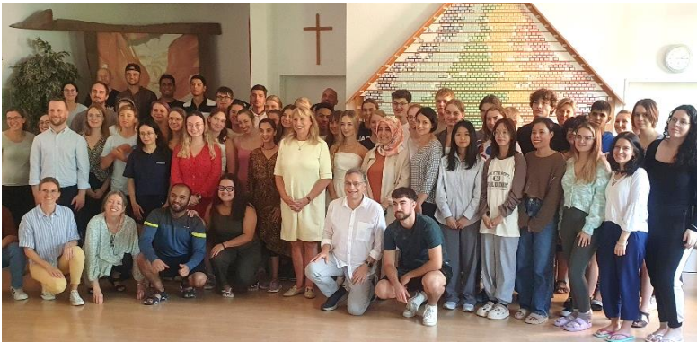
Foto: Interkulturelle Einführung, hier mit der Sächsischen Staatsministerin für Soziales, Frau Petra Köpping, die uns während des Seminars besuchte. Sie kam mit den Freiwilligen (Aufnahme und Entsendung) ins Gespräch und versprach, sich für die Erleichterung der Visum-Problematik bei den Incoming-Freiwilligen einzusetzen.