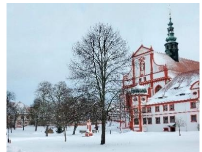
Foto: Dieser Wintergruß kommt von Elen, Freiwillige 23-24 im Maria-Martha-Heim in Panschwitz-Kuckau. Sie betreute dort Menschen mit Behinderungen.