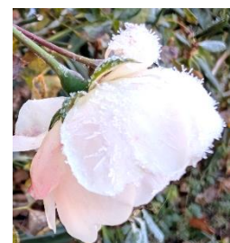
Foto: Weiße Rose im Winter am Hans-und-Sophie-Scholl- Haus – Zeichen der Hoffnung auch in frostigen Zeiten