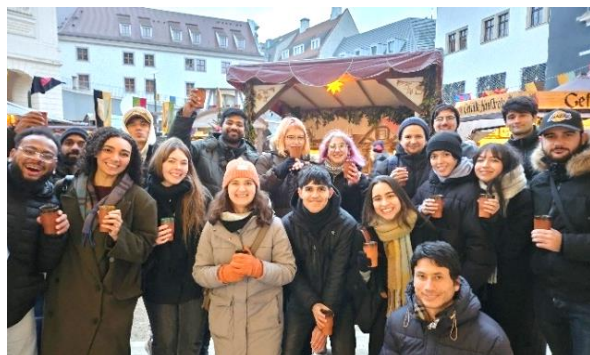
Grüße vom Dresdner Weihnachtsmarkt – Abschluss des Regionaltreffens für aktuelle Incoming-Freiwillige

In dieser Zeit der Erwartung bereiten sich 32 junge Erwachsene im Alter von 18 bis 30 Jahren auf ihre Reise nach Deutschland im Februar 2026 vor. Aus Ländern wie z.B. Brasilien, Vietnam, Madagaskar und Simbabwe sind sie bereit, für ein Jahr ihr gewohntes Leben aufzugeben und einen ganz anderen Lebensstil zu beginnen. Sie werden Erwachsene und Kinder mit geistigen und körperlichen Behinderungen unterstützen. Einige von ihnen haben bereits Erfahrung in diesem Bereich, für andere ist es das erste Mal. Sie alle freuen sich darauf.